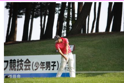
【本大会初の入賞 ゴルフ少年男子】

本大会初の入賞を果たしたのは、ゴルフ競技少年男子。結果は第6位と選手も決して満足のいくものではなかったが、初日の9位から挽回し、堂々の入賞を果たした。一昨年度優勝など近年は常に上位入賞を果たしている。今年度の選手は3年生、2年生、1年生で構成されており、来年度は更なる活躍が期待される。